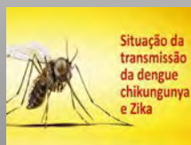
Situação no Brasil 02/2016

Cada um pode fazer a sua parte. Participe! Conheça o Movimento Nacional para os ODS.